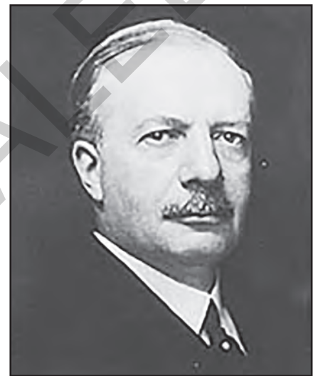
André Maginot (1877-1932)

Linia Maginot , un ansamblu de fortificații denumit după ministrul francez al apărării, André Maginot, constând într-un șir de elemente defensive, pe care Franța l-a construit de-a lungul graniței cu Germania, ca urmare a experienței acumulate în urma Primului Război Mondial.