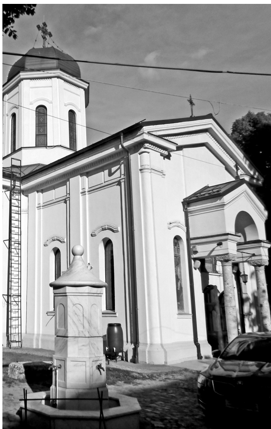
Biserica Mavrogheni, fotografie actuală