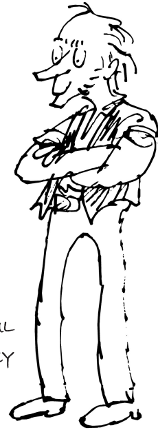
DOMNUL KILLY KRANKY