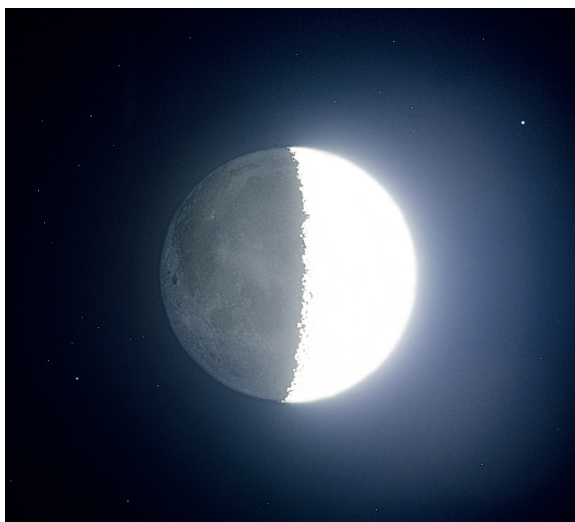
Luna în creștere, cu lumina sa „gri-cenușie”

O trecere în revistă a celor 3000 de stele care pot fi detectate cu ochiul liber poate deveni foarte plictisitoare. Astronomul amator are tot dreptul să gândească astfel. Dar cum poate fi el ajutat? Dacă dvs., cititorul nostru, vă recunoașteți în aceste rânduri, mergeți la un observator astronomic din apropiere și uitați-vă la corpurile cerești cu instrumentele accesibile publicului.