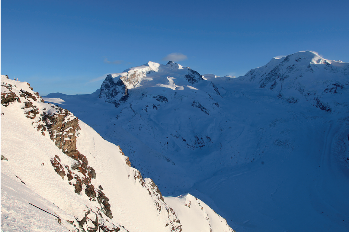
Peisaj cu zăpadă albă și albastră

pe de orizont, pare în schimb tot mai galben-portocaliu, portocaliu sau chiar roșu-portocaliu. Având în vedere că nimeni nu poate susține cu seriozitate faptul că Soarele își schimbă culoarea, trebuie că aici acționează un alt proces – poate chiar același, care este răspunzător de albastrul cerului. Pentru aceasta, să privim imaginea de la pagina 8. În partea dreaptă, Soarele este sus pe cer, iar calea parcursă de lumina sa prin atmosfera Pământului este izbitor de scurtă – doar pe ultimii aproximativ 50 de km până la sol trebuie să străbată un strat de aer de o densitate considerabilă, chiar crescătoare cu cât este mai aproape de Pământ. În partea stângă în schimb, pentru același observator Soarele este jos, la orizont. Deasupra atmosferei, lumina Soarelui este în continuare albă. În schimb observatorul de la sol vede Soarele roșiatic, chiar și cerul fiind acum scaldat în lumină roșie. Chiar și fără o analiză geometrică exactă se vede imediat că drumul