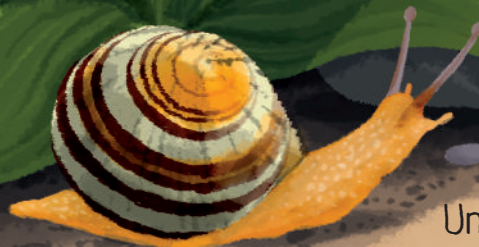
Melc (cu cochilie)